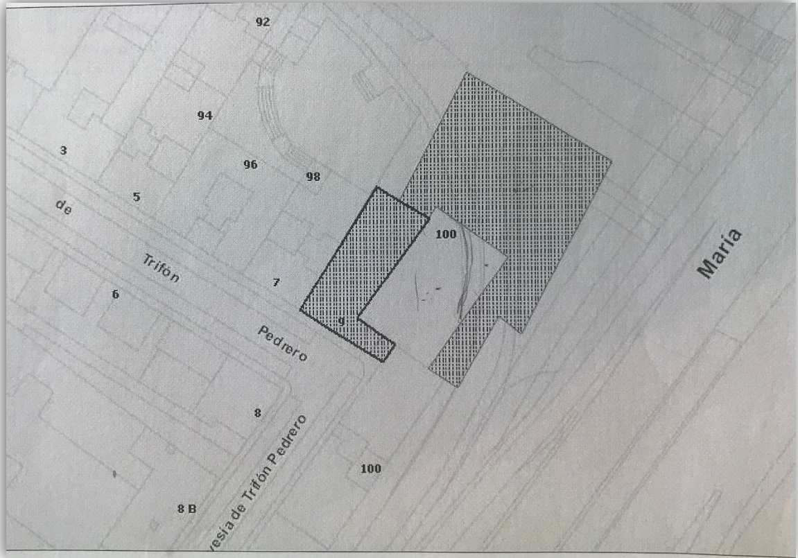
Documentación gráfica del Inventario Municipal del Suelo

El espacio libre delimitado por la Travesía de Trifón Pedrero, Pº de Sta. Mª de la Cabeza y C/ Antonio López, está constituido por tres fincas, de las cuales dos forman parte del Patrimonio Municipal de Suelo (PMS):